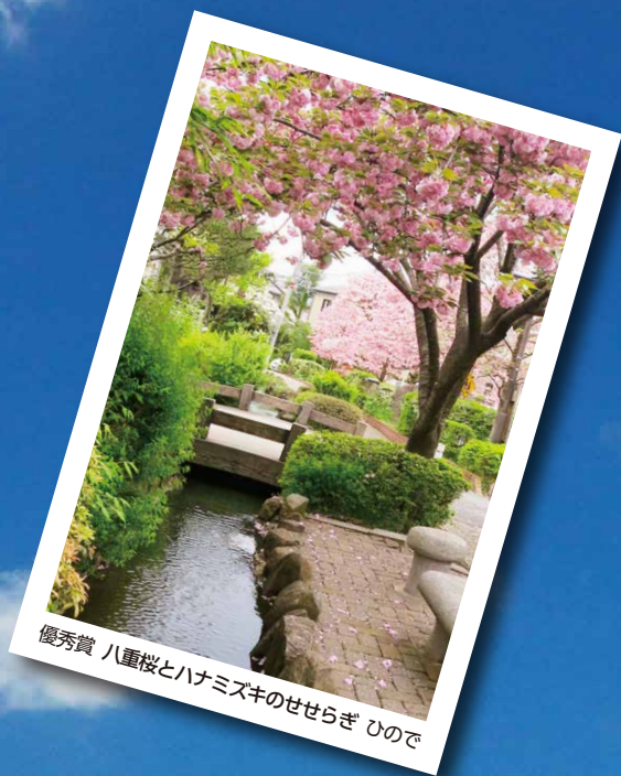
優秀賞 八重桜とハナミズキのせせらぎ ひので