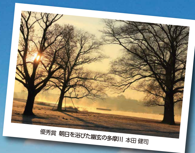
優秀賞 朝日を浴びた幽玄の多摩川 本田 健司